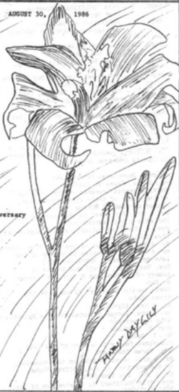
40 th anniversary issue of the Montreal Bulletin