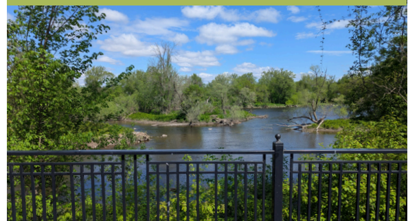
VIEW OF THE YAMASKA RIVER FROM THE MEMORIAL SITE IN PARC WILSON, FARNHAM, QC.