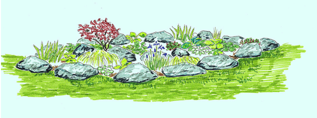
DRAFT SKETCH OF MEMORIAL GARDEN, STEPHEN KAWAI