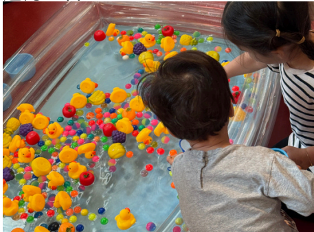
(写真左：ヨーヨー釣りを楽しむ子供達 写真右：ホッケースティックでスイカ割り)

また、幼児部のクラスではスイカ割りを楽しむ姿も見られました。スイカ割りと言えば日本の夏の風物詩ですが、ホッケースティックでのスイカ割りはカナダならではの！日本とカナダ、両方の文化が自然に融合した体験ができるのは、モントリオール日本語センターならではの魅力と言えますね！