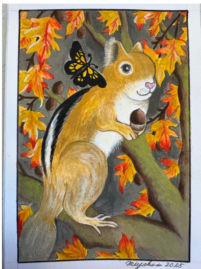
Left: Drawing of chipmunk by Miyako Pelletier